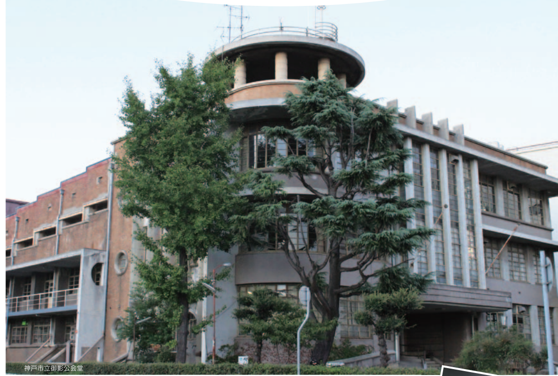
神戸市立御影公会堂