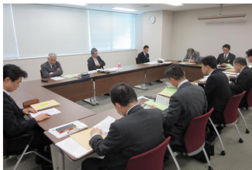
安全施策 2017 マネジメントレビュー

マネジメントレビューとは、安全管理体制が適切に運営され、有効に機能しているかを確認し、必要に応じて見直し、改善する活動です。毎年、都市交通事業本部の各部長から社長へ安全施策の実施結果を報告しています。