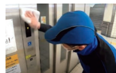
押しボタンの消毒