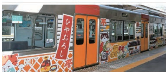
ラッピングトレイン「Go!Go!灘五郷!」外観

灘五郎酒造組合、神戸市及び西宮市とともに取り組む『「灘の酒蔵」活性化プロジェクト』の一環として、2020年10月13日からラッピングトレイン「Go!Go!灘五郷!」第2弾の運行を開始しました。