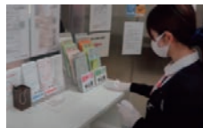
カウンターの消毒