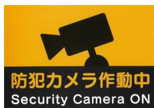
ステッカーイメージ

防犯カメラを設置している車両につきましては、ステッカーを掲出しています。また、カメラ映像は暗号化するとともに取扱う従業員を限定する等、個人情報の漏えい等を防止するための措置を厳重に講じています。