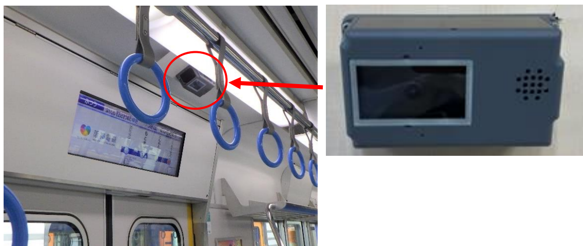
防犯カメラ設置イメージ